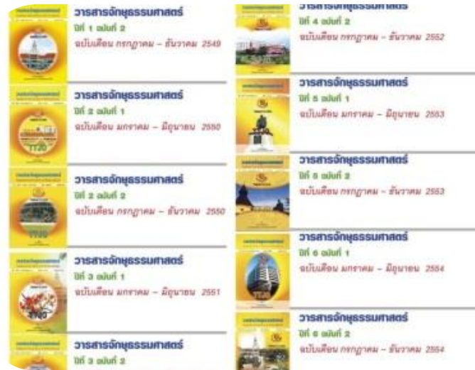
วารสารจักษุธรรมศาสตร์