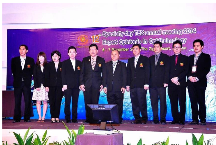
งานจักษุแพทย์ภาคกลาง