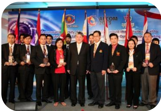
งานประชุมวิชาการคณะแพทยศาสตร์ Asian Economic Community ophthalmology meeting ครั้งที่ 1

เพื่อให้สอดคล้องต่อวิสัยทัศน์ของมหาวิทยาลัยธรรมศาสตร์และคณะแพทยศาสตร์ด้านความเป็นนานาชาติ ภาควิชาจักษุวิทยาจึงดำเนินโครงการด้านความเป็นนานาชาติในหลายรูปแบบ