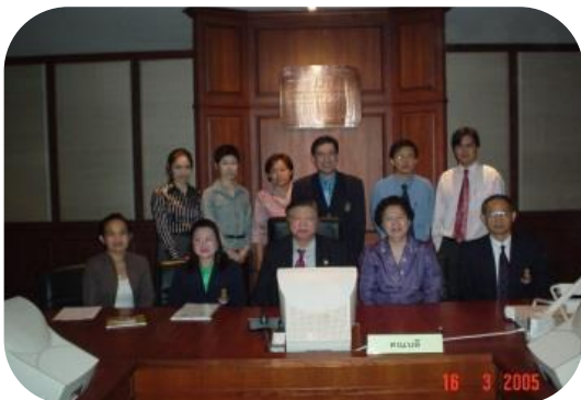
ประเมินสถาบันฝึกอบรม