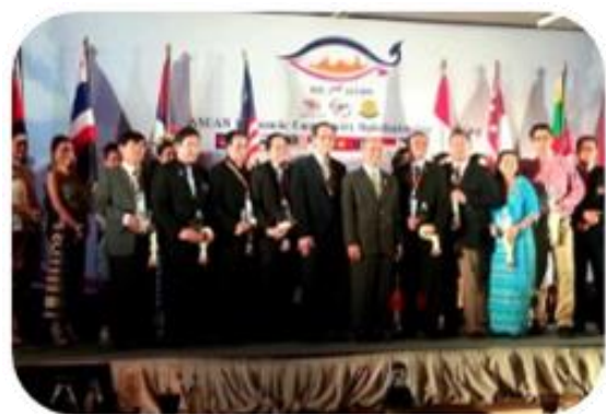
งานประชุมวิชาการคณะแพทยศาสตร์ Asian Economic Community ophthalmology meeting ครั้งที่ 2