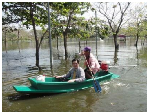
ภาพน้ำท่วมธรรมศาสตร์ปีพ.ศ. 2555

ภาควิชาจักษุวิทยามีการเติบโตและพัฒนาในด้านต่างๆสอดคล้องกับแนวทางของคณะแพทยศาสตร์และมหาวิทยาลัยธรรมศาสตร์ด้วยความร่วมมือร่วมใจของคณาจารย์และบุคลากรที่เกี่ยวข้อง เชื่อว่าในช่วงทศวรรษต่อไปก็จะยังคงเป็นทศวรรษแห่งการพัฒนาเพื่อเป็นพลังในการร่วมขับเคลื่อนให้มหาวิทยาลัยธรรมศาสตร์เป็นมหาวิทยาลัยเพื่อประชาชน