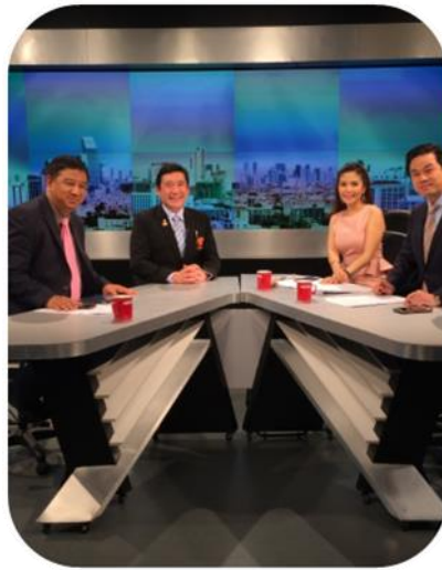
เผยแพร่ความรู้สู่ประชาชน