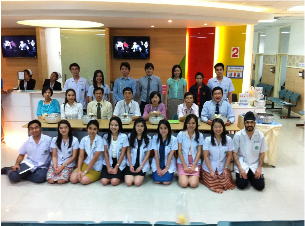
จักขุธรรมศาสตร์