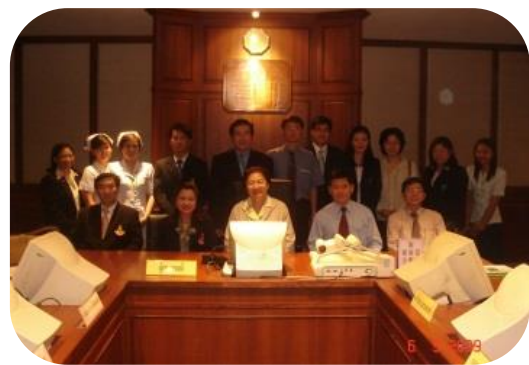
ประเมินเพิ่มเรชิตินที่ฝึกอบรมเป็น 5 คน