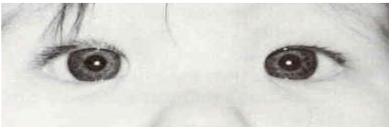
รูปแสดง ตาเขชนิดหลอกที่ดูคล้ายตาเขเข้าใน

ลักษณะของตาที่ดูเฝินๆ คล้ายตาเข เมื่อตรวจจริงๆ ไม่เข มักพบในเด็กที่มีลักษณะรูปร่างเปลือกตาค่อนข้างเล็กหรือเอียงขึ้นบนเล็กน้อย หรือขอบเปลือกตาด้านหัวตาโค้งต่ำกว่าปกติ ทำให้แลดูลูกตาเหมือนอยู่ชิดหัวตา เหมือนตาเขเข้าใน ยิ่งร่วมกับลักษณะดั่งจมูกแบนราบยิ่งเห็นชัดขึ้น