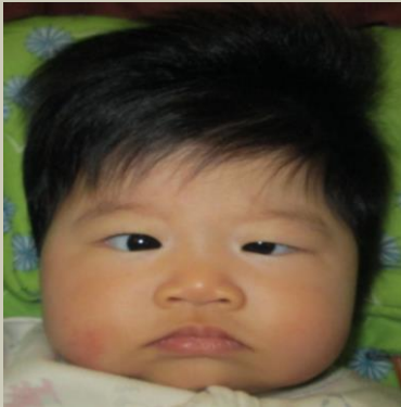
รูปแสดง ตาเขชนิดเข้เข้าใน

ตาเขหรือตาเหล่ คือ ภาวะที่ตาทั้งสองไม่อยู่ในแนวตรงตามธรรมชาติ แทนที่จะเห็นตาข้างหนึ่งตรงดี แต่อีกข้างกลับหันเข้าด้านหน้าตา เผลอออกไปทางหางตา เลขึ้น หรือเหลง อาจจะเป็นตาใดตาหนึ่ง หรือสลับข้างกันไปมา โดยที่เจ้าตัวไม่ค่อยรู้สึก ไม่รู้ว่าใช้ตาไหนมอง เพราะความเคยชิน