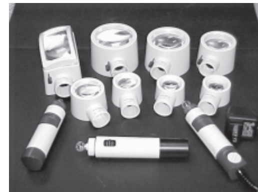
รูปเครื่องมือช่วยการมองเห็น