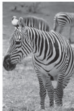
รูปตาปกติ

ไม่ชัดเจน การรักษาต้องทำการแก้ไขภายใน 8-10 ขวบ โดยต้องรักษาสาเหตุเหล่านั้น และพยายามให้เด็กใช้ตาข้างที่เป็นตาขี้เกียจ โดยการปิดตาที่ดี เพราะเมื่อ อายุเกิน 8-10 ขวบแล้ว จะไม่สามารถรักษาโรคตาขี้เกียจให้ดีขึ้นได้ตลอดไป