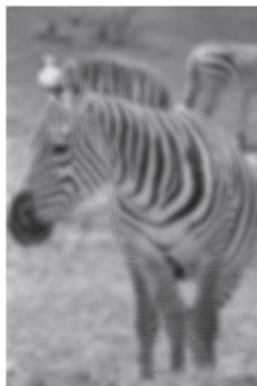
รูปตามัว

สายตาสั้น ขี้เกียจคือภาวะที่ตามัว การมองเห็นลดลง แม้แก้ไขสายตาสั้นที่ผิดปกติด้วยแว่นตาที่ถูกต้องแล้ว โดยไม่มีโรคอื่นของตา สาเหตุเกิดจากในช่วงที่ประสาทตามีการพัฒนาของการมองเห็น (8-10 ขวบแรก) ตาข้างนั้นหรือทั้ง 2 ข้างไม่ได้รับการกระตุ้นอย่างเหมาะสม มักจะเป็นผลจากตาเข สายตาสั้น ยาว เอียง หรือโรคอื่นๆ ที่ทำให้การรับภาพจากตาส่งไปยังสมอง