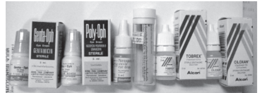
รูปยาปฏิชีวนะหยอดตาที่มีขายในประเทศไทย

1. ตาสู้ภัยระยะแรก อาจมีเพียงอาการเจ็บ แดงเล็กน้อยบริเวณเปลือกตา การรักษาให้ประคบอุ่นครั้งละ 15 นาที วันละ 4 ครั้ง, ใช้ยาปฏิชีวนะและห้ามขยี้ตา โดยถ้ามีอาการเจ็บแดงบริเวณด้านในของเปลือกตา ใช้ยาปฏิชีวนะหยอดตา เช่น Poly-oph ® , Neosporin ® หรือ Tobramycin หยอดตาวันละ 4 ครั้ง และถ้ามีการอักเสบติดเชื้อ (บวม แดง) ของเปลือกตาบริเวณรอบๆ ร่วมด้วยให้ใช้ยาปฏิชีวนะ เช่น Amoxycillin ชนิดรับประทานร่วมด้วย