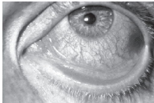
รูปตาสู้ภัยแบบด้านใน