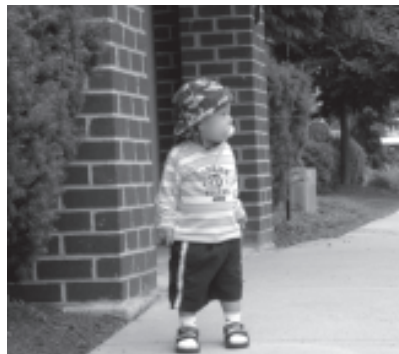
รูปการมองเห็นของคนปกติ