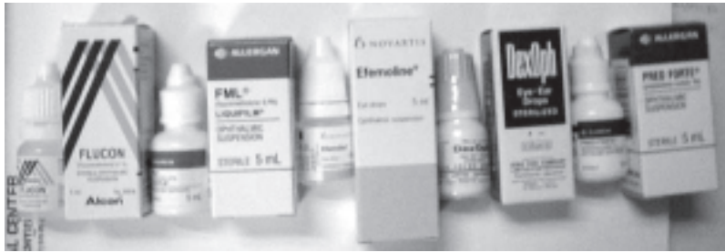
รูปยาหยอดตาประเภทสเตียรอยด์ ที่มีขายในประเทศไทย

การรักษาต้อหินจะไม่สามารถทำให้เซลล์ประสาทตาที่เสียไปแล้วคืนกลับมาได้ แต่เป้าหมายของการรักษาคือไม่ให้สายตาสีเทาไปมากกว่านี้ ดังนั้นถ้ามีอาการปวดตาและโดยเฉพาะถ้ามีตาแดงร่วมด้วยให้รีบไปตรวจตา ส่วนผู้ที่มีอายุ 40 ปีขึ้นไป ควรได้รับการตรวจตาอย่างน้อยปีละ 1 ครั้ง เพื่อตรวจพบโรคตั้งแต่ระยะแรกๆ โดยเฉพาะผู้ที่มีประวัติคนในครอบครัวเป็นต้อหิน จะมีโอกาสเป็นต้อหินได้มากกว่าคนทั่วไป