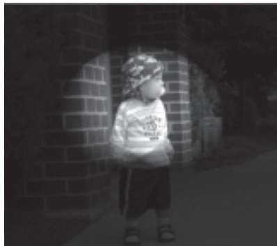
รูปการมองเห็นของคนเป็นต้อหินจะมีลานสายตาแคบลง

2. ต้อหินชนิดเรื้อรัง ความดันลูกตาจะสูงขึ้นช้าๆ ในเวลาเป็นเดือนเป็นปี ดังนั้นตาจะมีเวลาปรับตัวได้ จึงอาจไม่มีอาการปวดตา ผู้ป่วยจึงมักไม่รู้ตัวว่าเป็นต้อหินอยู่ จึงยังไม่ได้รับการรักษา ประสาทตาจะเสื่อมลงเรื่อยๆ ลานสายตาจะแคบลงมากขึ้นๆ จนผู้ป่วยสังเกตว่าตมัวลง จึงมาพบแพทย์เมื่อโรคเป็นมาอยู่แล้ว ซึ่งการรักษาที่เพียงแต่ช่วยป้องกันไม่ให้ประสาทตาเสียไปมากกว่านี้ แต่ไม่สามารถช่วยให้ประสาทตาส่วนที่เสียไปแล้วคืนกลับมาได้ ดังนั้นความสำคัญของต้อหินชนิดนี้จึงอยู่ที่การค้นพบโรคตั้งแต่ระยะแรก ดังนั้นในผู้ที่มีอายุมากกว่า 40 ปีทุกคนซึ่งถือว่าเป็นมีความเสี่ยงต่อการเป็นโรคนี้