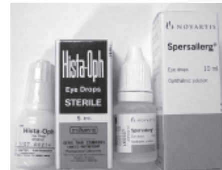
รูปยาต้านฮีสตามีน

สำหรับการรักษาโรคต้อเนื้อนั้นต้องหลีกเลี่ยงแสงแดดจัด ลม ฝุ่น ควันเข้าตา อาจใส่แว่นกันแดด กันลม ถ้ามีอาการเคืองตาให้หยอดยาเพื่อลดอาการ นิยมใช้ยาหยอดตากกลุ่มยาต้านฮีสตามีน (antihistamine) เช่น Hista-oph ® หรือ Spersallerg ® หรือ Opsil-A ® เช่นเดียวกับโรคต้อลม โดยหยอดครั้งละหยดเมื่อมีอาการเคืองตา แต่การใช้ยาเป็นประจำต่อเนื่องนานๆ อาจทำให้เกิดภาวะแสบตาจากตาแห้งได้ จึงควรหยอดยาเฉพาะเมื่อจำเป็น